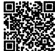
QR Code ลงทะเบียนออนไลน์