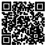
QR Code ลงทะเบียนออนไลน์

1.ลงทะเบียนออนไลน์ได้ที่ http://med.mahidol.ac.th/nursing/ 2. หลังจากโอนเงินผ่านธนาคารเข้าบัญชีของศูนย์การศึกษาต่อเนื่อง ทางการพยาบาลรามาธิบดีแล้ว กรุณาส่งใบสมัครพร้อมสลิปการโอนเงิน มายังศูนย์การศึกษาต่อเนื่องทางการพยาบาลรามาธิบดี ทางโทรสาร 02- 201-2011 หลังจากที่ได้รับโทรสารแล้วขอให้โทรศัพท์สอบถามว่าเจ้าหน้าที่ ได้รับเอกสารที่ท่านส่งมาครบถ้วนถูกต้องหรือไม่ ที่เบอร์โทรศัพท์ หมายเลข 02-201-1608, 02-201-1512 หรือส่งใบสมัครพร้อมสลิปการ โอนเงินทางอีเมล rama.ccne@gmail.com และหลังจากนั้น 1 สัปดาห์ ให้ท่านตรวจสอบรายชื่อได้ที่ http://med.mahidol.ac.th/nursing/